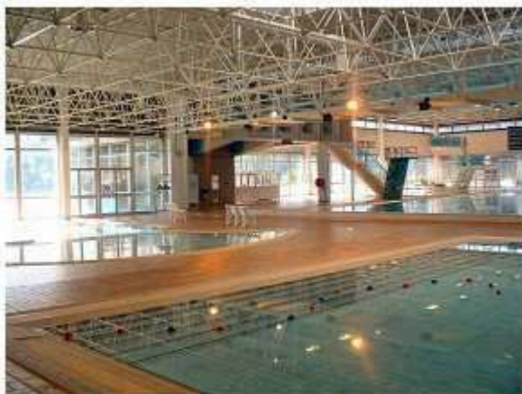
Бассейн Раймон Сомме, Сент-Этьен (Франция)