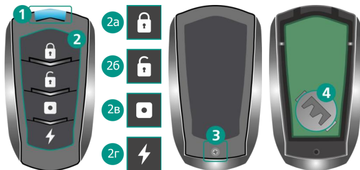
1. Индикатор светодиодный 2. Функциональные кнопки